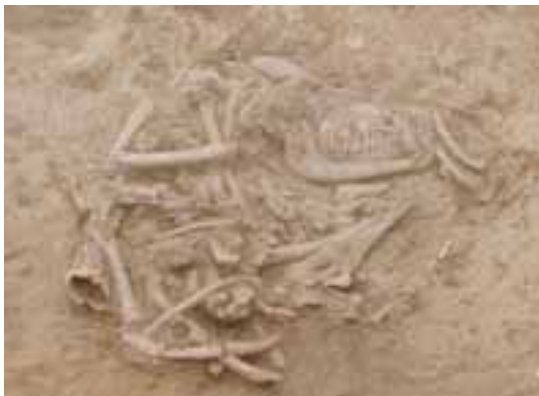
FIGURA 1. Lloma de Betxí. Esqueleto completo de cabra.

Un interesante hallazgo de la campaña de excavación del año 2010 son los restos completos de una cabra y entre ellos, no todos conservados, los de un feto de la misma especie, de manera que la cabra se encontraba preñada en el momento de su muerte (figura 1). Los restos fueron hallados en deposición primaria en el Sector Este del yacimiento. Se ha calculado una edad de muerte, por el desgaste oclusal de los dientes, de entre 3 y 4 años (Payne, 1973), mientras que el estudio epifisario nos revela una edad comprendida entre 2 y 3 años (Silver, 1980), ya que las epífisis proximales de los húmeros, las tibias y los caput femorales, además de las epífisis distales de los radios, ulnas y fémures, no están fusionadas. De los restos del feto se encontraron todos los lados corporales de los miembros anterior y posterior, y de la parte axial únicamente un fragmento de costilla y 3 fragmentos de vértebras. Al cribar el sedimento que cubría a estos restos, se hallaron minúsculos fragmentos de hueso de imposible remontaje que probablemente correspondan al cráneo y las falanges del feto, y cuya fragmentación se deba a la fragilidad de estos huesos y a los procesos postdeposicionales que hayan podido sufrir. Al tratarse de un enterramiento intencionado no se han considerado como restos de desperdicios domésticos, y por esa razón no se han contabilizado en la muestra.