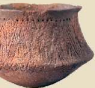
Vas amb decoració cardial ▶ de la Cova de l'Or (Beniarrés), 5.500 aC