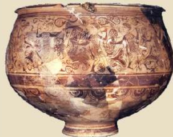
Vase des Guerriers du Tossal de Sant Miquel (Lliria), III-II e s. av. J.-C.

Le Tossal de Sant Miquel (Lliria) , ancienne Edeta , a fourni une collection extraordinaire de céramiques peintes à thèmes figuratifs, comme le " Vaso de los Guerreros ", qui nous montrent les rites, cérémonies, défilés et mythes de la société ibérique. Edeta était la capitale d'un territoire très étendu constitué de bourgades, comme la Monravana (Lliria) et la Seña (Villar del Arzobispo) , qui étaient chargées d'approvisionner la cité en produits agricoles. Les fermes fortifiées, comme le Castellet de Bernabé (Lliria) , étaient des domaines où le propriétaire terrien gérait l'exploitation de l'environnement immédiat ; les fortins, comme le Puntal del Llops (Olocau) , contrôlaient et défendaient le territoire.