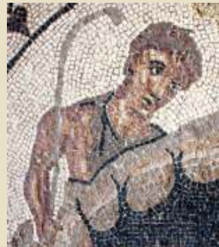
Mosaïque de Font de Mussa (Benifaio), II e s. av. J.-C.

Plusieurs scénographies reproduisent les différents aspects de la culture romaine. Le parcours du commerce débute avec une reconstitution d'une épave et une présentation de monnaies, vaisselles d'importation et amphores de toute la période romaine dans la coque d'un navire marchand. La maquette d'une ville, associée à des objets de la vie quotidienne et des matériaux de construction, illustre le milieu urbain, tandis que les trouvailles de la villa de Font de Mussa (Benifaio) et du Pla de l'Arc (Lliria) , accompagnées de la magnifique sculpture en bronze de l'Apolon de Pinedo , nous plongent dans l'ambiance rurale. La scénographie de plusieurs tombes et plaques funéraires de l'aire valencienne est complétée par les mobiliers des nécropoles de Tisneres (Alzira) et une importante collection d'inscriptions et lucernaires, paiennes et chrétiennes, de provenances diverses. La période wisigoth est représentée par les matériels provenant du monastère de la Punta de l'Illa (Cullera) et la villa aulique du Pla de Nadal (Riba-roja de Túria) . Les céramiques, inscriptions, monnaies, éléments architectoniques et croix liturgiques en bronze illustrent les caractéristiques de cette période située entre la fin du monde ancien et le début de l'ère médiévale.