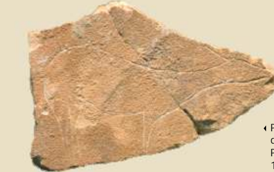
Plaque gravée de la Cova del Parpalló (Gandia), 18 000 avant le présent.

Durant le Paléolithique supérieur, les groupes humains s'expriment au travers de productions artistiques aussi diverses que les peintures et gravures d'animaux et les signes sur les parois des grottes ou sur des plaquettes en pierre, ainsi que la décoration des outils en os ou les différents types de parures personnelles. La Cova del Parpalló (Gandia) a fourni une collection exceptionnelle de plus de 5 000 plaquettes en pierre gravées et peintes qui montre l'évolution des techniques et des thèmes propres à ces sociétés du Paléolithique entre 25 000 et 10 000 ans avant le présent.