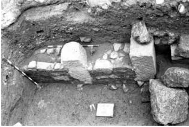
Muro de buena factura del interior del circo romano. Calle Comedias, Valencia. SIAM-Ajuntament de València.

pequeña basílica, pero la falta total de cualquier indicio de los muros perimetrales nos hacen ser escépticos al respecto. Las remociones de una casa islámica de los siglos XI al XIII, al oeste del ábside, impide que se conozca mejor.