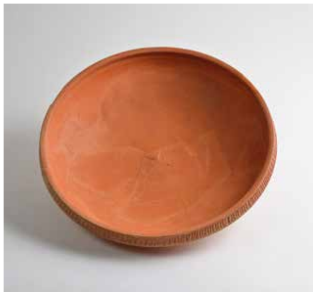
Bol de cerámica de mesa de Asia Menor. Plaza Nápoles y Sicilia, nº 10. València, SIAM-Ajuntament de València.

Pero el repentino colapso del reino visigodo no supuso una rápida ruptura social, ya que la islamización fue un proceso continuo pero lento. En parte del área valenciana, a través del pacto suscrito por el último gobernador visigodo, Teodomiro, con los recién llegados, el modo de vida permaneció inalterado hasta mediados del siglo VIII, con la instalación de contingentes árabes, que en parte se unieron a la antigua élite goda.