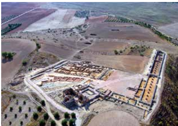
Imagen aérea de Reccopolis. Proyecto Reccopolis.

A1, A2, A3: Complejo palatino; B: Iglesia palatina; C: Acceso Complejo Palatino; D y E: Edificios asociados con actividades artesanales y comerciales; F1, F2 y F3: Viviendas; G: Calles; H: Zona abierta Complejo Palatino; I: Zona abierta; J: Canalización; K: Cisterna.