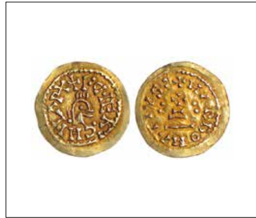
Trient d'Akhila II de Narbona. Museu Arqueològic Nacional.

pareix que representa una àguila. Si la nostra percepció és encertada, es deu tractar no sols d'una tipologia sense precedent sinó de la mateixa concepció que parla del tipus que deu demostrar que la moneda dels moments precedents a la fi del Regne visigot començava a prendre un rumb molt allunyat dels models imperials.