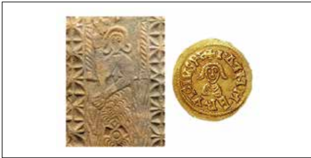
[BAIX] Placa de las Tamujas (Malpica, Toledo) i anvers de trient d'Ervigi d'Ispli.

nat independent en el nord-est de la península Ibèrica i Narbona, sota Àkhila II.