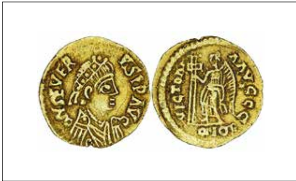
[DALT] Trient visigot de Teodoric II o Euric a nom de Libi Sever (461-465). Bibliothèque National de France, París.