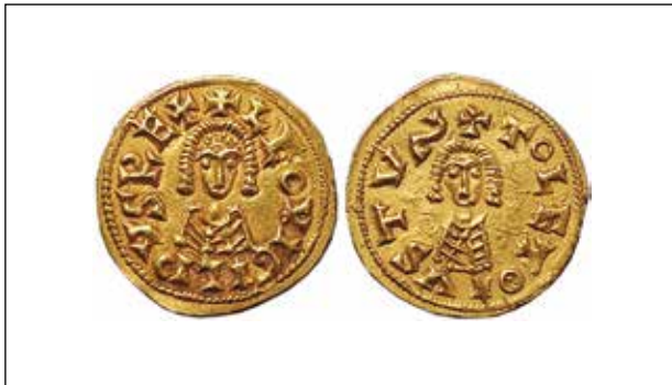
Trient de Leovigild de Toledo . American Numismatic Society

banda, ahora que s'hi adopten els tipus romans, no se'ls pot negar un sentit tremendament creatiu que fins i tot és evident en l'etapa que s'estén fins al regnat de Khindasvint, en la qual, sobre l'homogeneïtat imposada pel bust de front, s'observa un intent de dotar de personalitat regional les encunyacions.