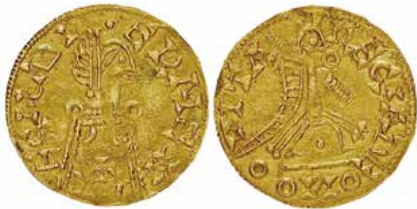
Trient d'Hermenegild (British Museum).

times, si fins aleshores havien sigut imitades, amb més o menys fidelitat, tant el nom com la nomenclatura imperial en sòlids i trients, i per tant l'al·lusió en poder continuava fent referència a l'emperador, durant el regnat de Leovigild es va començar a incloure el nom del monarca visigot. Sense entrar a discutir si va ser a iniciativa del rei legítim o bé del rebel Hermenegild, la veritat és que les dues emissions conegudes d'aquest últim inclouen el seu nom en les llegendes.