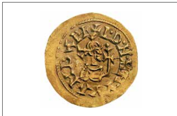
Anvers de trient de Vamba de Toledo. (Kung. Myntkabinettet Nationalmuseum, Stockholm)

En aquest interès per mostrar el caràcter sacre de la monarquia, en els temps d'Ervigi (680-687) va tindre lloc una important innovació tipològica que es va sumar al repertori monetari visigot: el Crist en majestat, que apareix amb un nimbe cruciforme que sorgeix del seu cap. Considerant que els bizantinistes tenen dades per a afirmar que aquesta tipologia només va ser introduïda en l'amonedament bizantí en el segon mandat de l'emperador Justinià II (685-695; 705-711), posant-la en relació amb el cànon 83 del concili de Trull de 692, és possible considerar Ervigi com el primer monarca de la cristiandat a utilitzar la iconografia de Crist pantocràtor en els seus amonedaments. Recentment hem plantejat que tal vegada hi haja una altra representació de Crist en el repertori d'Ervigi, encara que en una actitud diferent. Si, en el cas del Crist en majestat, disposem del relleu de l'església de Quintanilla de las Viñas (Burgos) com a prototip present en una altra manifestació artística, la seca d' Ispali , entre les tipologies usades per aquest monarca, disposa d'una que s'assembla a la figura representada a la Placa de las Tamujas (Malpica, Toledo). Com s'observa en la figura inferior, el cabell adopta la mateixa forma que el de