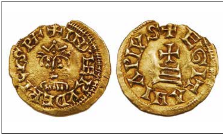
Trient de Roderic d'Egitania. Museu de Conimbriga.