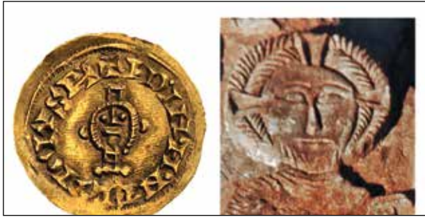
[DAL] Anvers de trient d'Ervigi d'Emerita (Kung. Myntkabinettet Nationalmuseum, Stockholm). Rellu de Crist en majestat, Església de Quintanilla de las Viñas (Burgos).