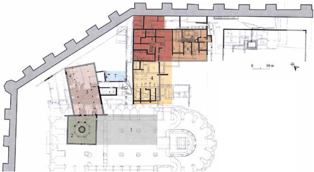
Planta del primer grup episcopal de Barcino en el segle v segons J. Beltrán de Heredia-Ch. Bonnet (Plànol © E. Revilla-M. Berti-MUHBA).

Barcinona representa un cas més complex ja que disposa de més documentació arqueològica. Hi destaquen la gran reforma del seu perímetre defensiu a finals del segle III i els resultats dels projectes de recerca del subsòl de la plaça del Rei i de l'església dels Sants Just i Pastor. En el segle VI la ciutat mantingué una clara rellevància política en tant que va ser cort reial de diversos monarques. El perquè fou Barcinona i no Tarracona no està ben clar. Però s'ha suposat que la situació del segle VI va ser hereva de la del segle V, quan Barcino ja havia aco-