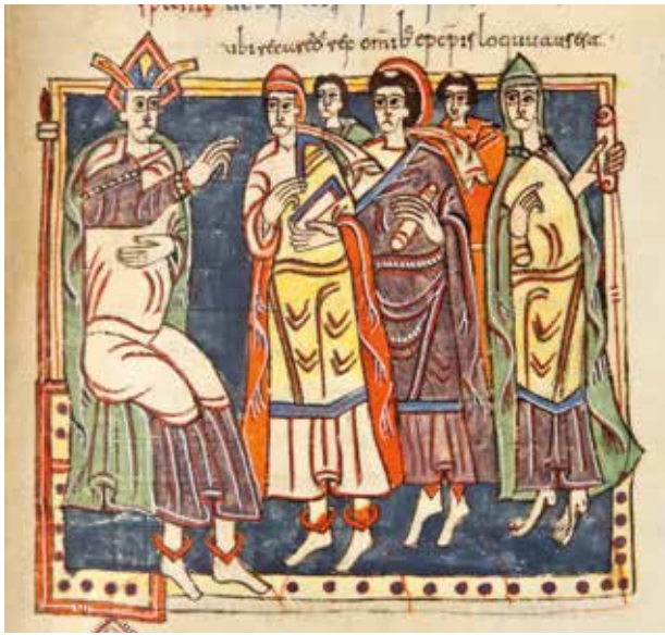
Rei visigot del Còdex Vigilanus o Albeldensis . Reial Biblioteca del Monestir de Sant Llorenç de l'Escorial. © Patrimoni Nacional.

regnes que es van consolidar en el panorama polític europeu després de la caiguda de l'Imperi romà. Al seu cap es trobava un monarca que basava el seu poder en l'existència d'una organització estatal plenament desenvolupada i, també, en el domini de la capital i de les seues institucions, que eren aquelles que legitimaven el seu poder. Un fet aquest que explica la necessitat de construir grans edificis administratius on instal·lar l'aula règia i diferents palaus en què albergar els seus principals membres civils i eclesiàstics amb ella relacionats, incloent-hi, en aquest cas, els primers bisbes primats d'Hispania.