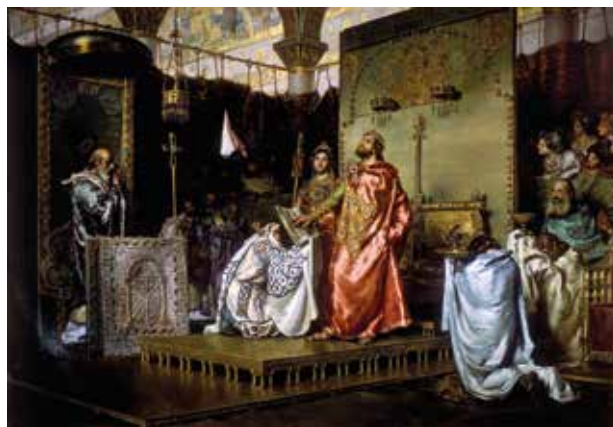
Antonio Muñoz Degrain, La conversió de Recared , 1888.

També en el segle XIX —el 1858—, va ser trobat el Tresor de Guarrazar, les corones i creus d'or i pedres precioses del qual es van convertir en una icona del visigotisme com a sinònim de l'origen de la nació espanyola. El tresor estava compost per dotze corones i huit creus, més algunes peces soltes. Algunes en van ser venudes a Toledo i adquirides pel govern francès; la resta va passar a formar part de les col·leccions reials gràcies a la tenacitat de José Amador de los Ríos, qui a més va aconseguir excavar el lloc on havia aparegut el tresor. El 1861 va publicar El arte latino-bizantino en España y las coronas visigodas de Guarrazar on defenia un concepte d'art genuïnament espanyol com a mescla dels estils romà i bizantí, alié a les pretensions de F. de Lasteyrie ( Description du Trésor de Guarrazar, accompagnée des recherches sur toutes les questions archéologiques qui s'y rat-