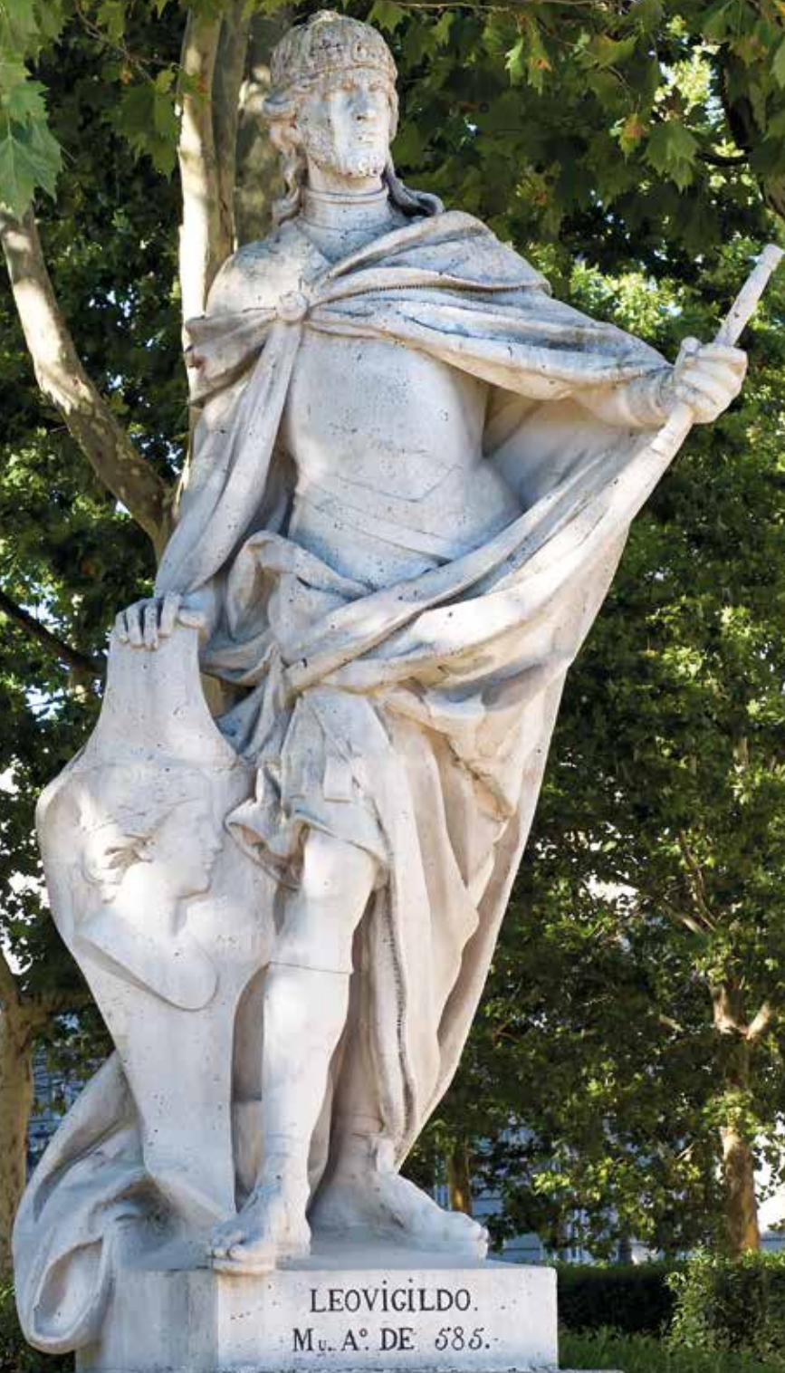
LEOVIGILDO. M. A.º DE 585.