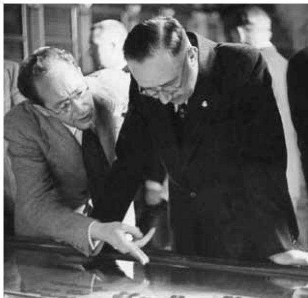
Julio Martínez Santa Olalla i el Reichsfürer Heinrich Himmler en octubre del 1940 en el Museu Arqueològic Nacional, contemplant les peces visigodes de la necròpoli de Castiltierra (Segovia).

Al final de la Segona Guerra Mundial, amb la victòria dels aliats, la influència de la ideologia nazi disminueix i el règim franquista es readapta. La mirada cap al visigot havia de subratllar el pes de la seua conversió al catolicisme com a model teocràtic per a l'autoritat del Cabdill. S'inicia el nacionalcatolicisme on l'Església catòlica va tindre un protagonisme especial en la recristianització de la població i l'exaltació del Cap de l'Estat, el poder del qual emanava directament de Déu. Els intel·lectuals van tornar la mirada a la historiografia romàntica de la segona meitat del segle XIX, recuperant discursos com els de Marcelino Menéndez Pelayo o, fins i tot, l'univers pictòric historicista que recreava el naixement i el baptisme de la nació en el III Concili de Toledo. La mateixa ciutat va ser objecte d'un programa de conservació i promoció patrimonial, com l'Alcàsser on, per a la historiografia feixista, s'havia escenificat la unitat espanyola en l'època visigoda. Poc de temps després, el 1960, es va inaugurar el Museu dels Concilis per a commemorar la ciutat on havia nascut «la unitat moral d'Espanya».